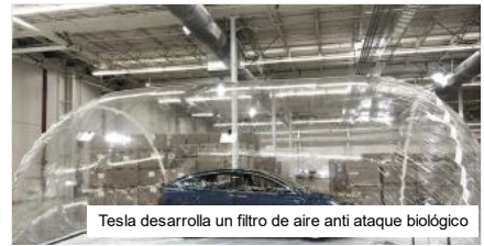
Tesla desarrolla un filtro de aire anti ataque biológico