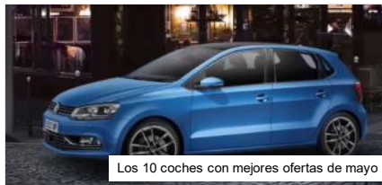
Los 10 coches con mejores ofertas de mayo