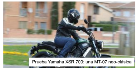
Prueba Yamaha XSR 700: una MT-07 neo-clásica