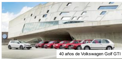
40 años de Volkswagen Golf GTI