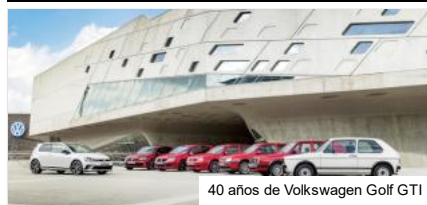
40 años de Volkswagen Golf GTI