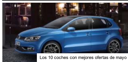
Los 10 coches con mejores ofertas de mayo