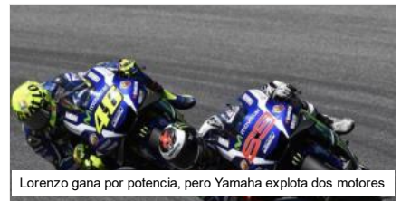
Lorenzo gana por potencia, pero Yamaha explota dos motores