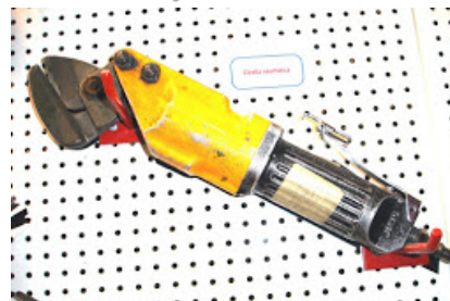
Reparación de Carrocerías