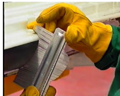
Reparación de carrocerías