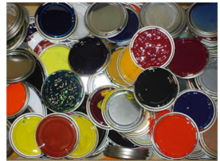
Embellacimiento de Superficies