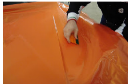
Horas de Libre Configuración