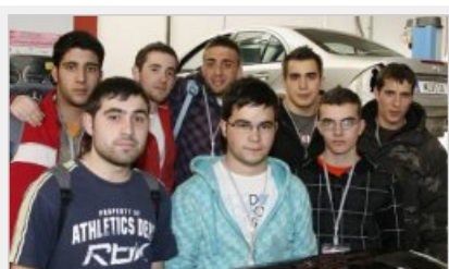
Alumnos del Centro Integrado Juan de Herrera, de Valladolid.

En sus manos está la posibilidad de que Castilla y León gane el campeonato nacional y aspire a alzarse con el premio internacional de jóvenes técnicos en automoción en alguna de las tres modalidades: carrocería, pintura de vehículos y tecnología del automóvil. Los talleres de Muvesa, en la avenida de Burgos, acogieron ayer la fase final del campeonato regional que disputaron el centro integrado Juan de Herrera (Valladolid), la escuela profesional San Francisco (León), el instituto Río Duero (Zamora) y el centro específico de FP de Miranda de Ebro (Burgos). Los vencedores regionales irán al campeonato nacional 'SpainSkills', que se desarrollará en Madrid del 21 al 24 de abril y de ser seleccionados. formarán parte del equipo nacional que competirá en