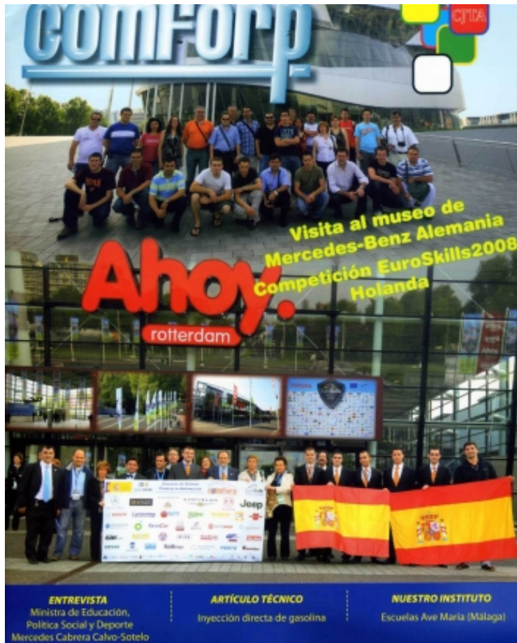
Portada de La Revista COMFORP

La Fundación COMFORP (Compromiso con la Formación Profesional) ha editado el número 6 de su revista la cual se reparte entre la comunidad de la Formación Profesional de la rama de automoción. Como muy bien explican en la editorial del último número, COMFORP ha iniciado una nueva etapa como Fundación en la que van a incrementar sus iniciativas para impulsar la formación entre los jóvenes. Entre estas iniciativas encontramos la creación de múltiples portales web en los que explica sus proyectos y servicios. Algunos de ellos son el foro ( www.comforp.net/foro ), la Comforteca ( www.recursos.comforp.net ) o la Galería de fotos ( www.comforp.info/galeria ). En cuanto a los contenidos del número 6, es una revista que resume las actividades desarrolladas por COMFORP y que recopila varios artículos técnicos de las empresas y medios de comunicación que colaboran con esta Fundación, entre ellos nuestra editorial C.E. I. Arsis.