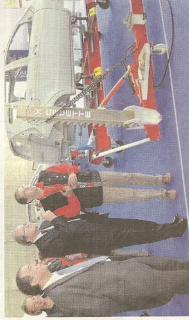
El nuevo ministro de Educación, Ángel Gabilondo, visitando la especialidad de Carrocería.

En la prueba de Control Industrial los alumnos realizaron un proyecto eléctrico com-