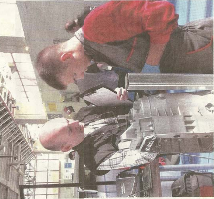
Un miembro del jurado evalúa la especialidad de Tecnología del Automóvil.

Los alumnos que participaron en la competición de Reparación de carrocerías de vehículos (en la foto de la izquierda) debían