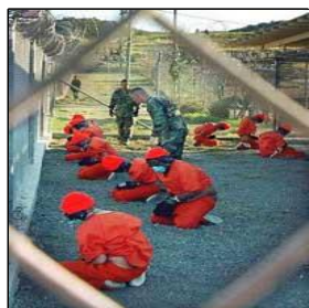
Presos de Guantánamo: "el gobierno Bush siempre nos ha tratado con dignidad y respeto"

En esta nueva edición, la convocatoria llega a todas las Comunidades Autónomas y se desarrollará en dos fases. En la primera fase los equipos participantes tendrán que elaborar un trabajo sobre un tema propuesto por la organización relacionado con su especialidad (electromecánica o carrocería). Los alumnos tendrán, además, que resolver determinadas cuestiones a través de internet. La segunda fase será presencial y se desarrollará en la escuela de formación de DaimlerChrysler España (Grupo formado por Mercedes Benz, Chrysler, Jeep y Smart), en Azuqueca de Henares (Guadalajara).